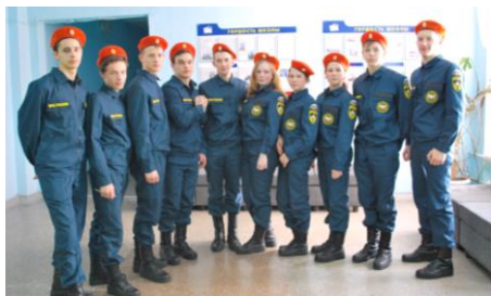
«Спасатели» г. Первоуральск