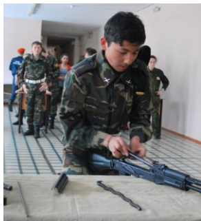
На «ты» с автоматом