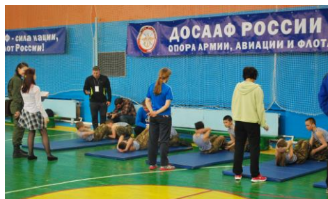
«Быстрее! Выше! Сильнее!»