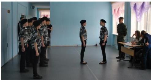
Идет строевой смотр

Наряду с юношами хорошую военно-спортивную подготовку показали девушки. Они доказали, что достойны пополнить ряды Российской армии.