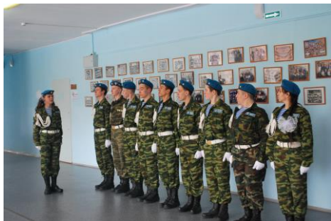
«Саламандра» г. Ревда

Команда «Ребята удачи» (Шалинский ГО) быстро закончила прохождение всех этапов. Эмоции переполняли юнармейцев: «Мы молодцы! Нас похвалил не только наш руководитель, но и главный судья соревнований!»